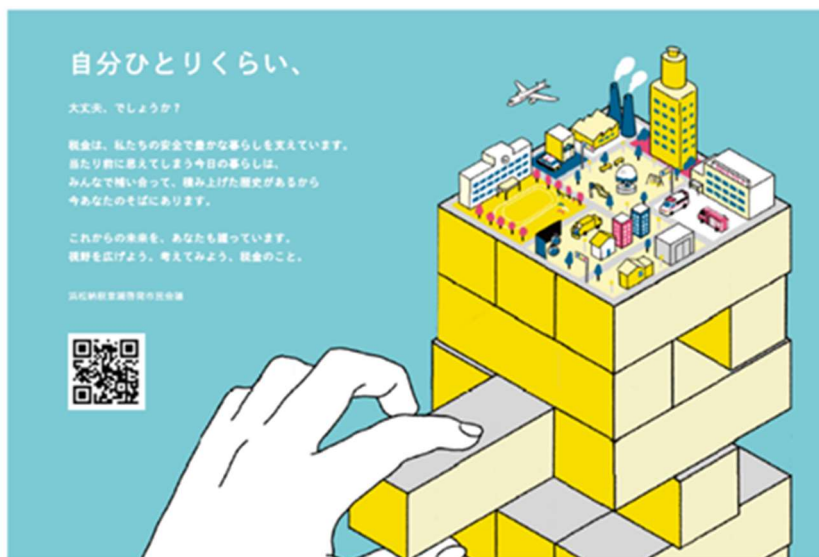
R4 年度 「税に関するポスターコンテスト」 優秀賞作品①