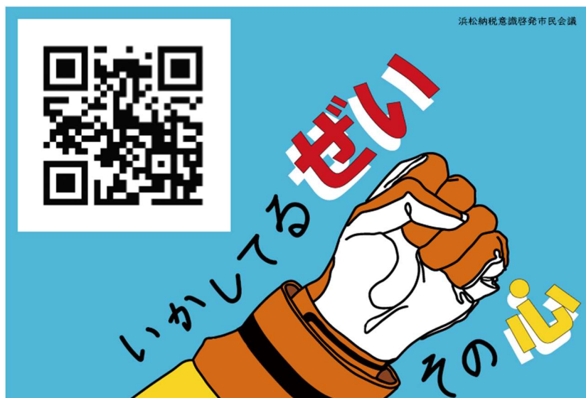
R4 年度 「税に関するポスターコンテスト」 優秀賞作品②